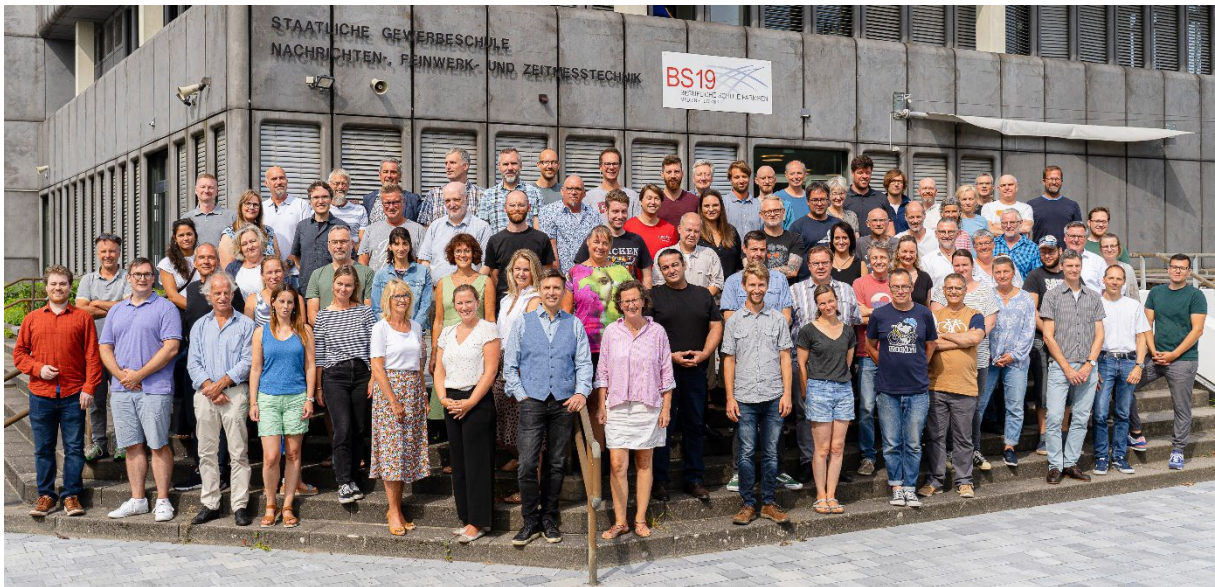
Kollegium und Mitarbeitende der BS19, August 2023